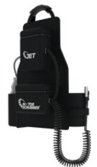
Pad Vert(1) 011-0072-10