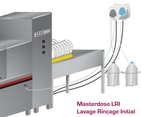
Masterdose LRI Lavage Rinçage Initial

Le Masterdose LRS permet un contrôle du grammage de produit du bain de lavage avec une sonde de résistivité. Il existe en différentes versions avec micro contrôleur et/ou avec un buzzer , alarme pour le contrôle de la concentration du produit dans le bain de lavage.